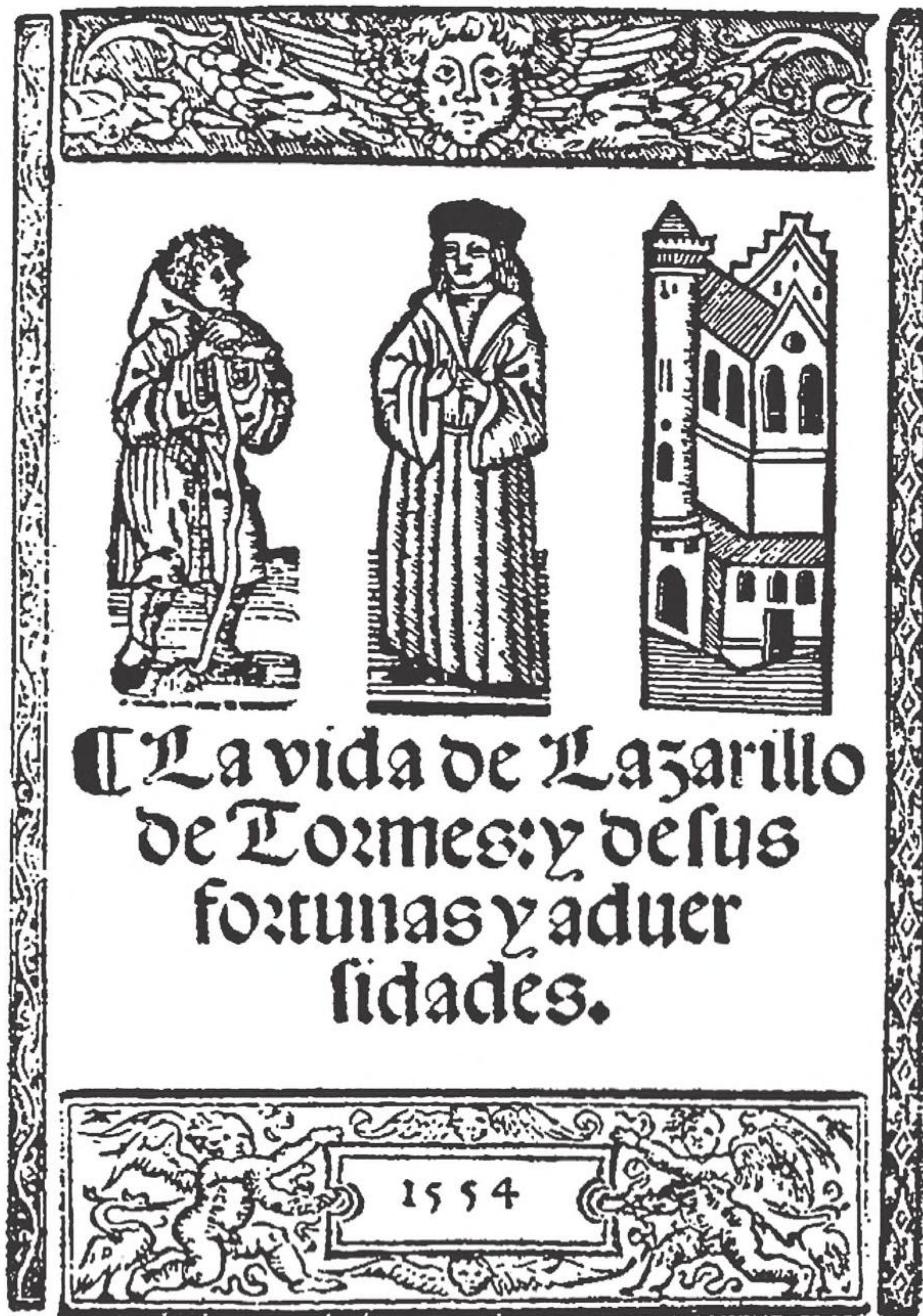
Portada de la edición de Burgos de 1554, impresa por Juan de Junta.